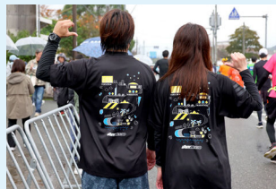
【写真は2025大会の記念Tシャツ】

本大会では参加賞としてのTシャツの提供はありません。「福岡マラソン大会記念Tシャツ」の販売については、6月30日(火)抽選結果通知にて、ご案内する予定です。お楽しみに。