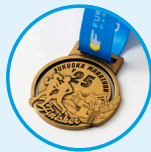
【完走タオル・完走メダルの写真は2025大会】