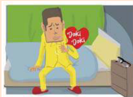
イラスト/西村アメリカ君