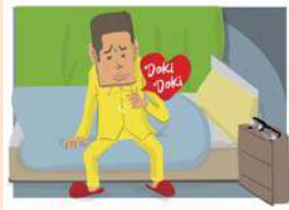
イラスト/西村アメリカ君