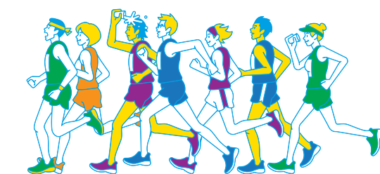
本内容は月刊ランナーズ2015年4月号をアレンジしています。

「最後の強化」で思い切り走った方が良いのか、「疲れを抜く」ために休養に専念した方が良いのか・・・意外と迷う2週間前。 疲労を残さず体調を万全にしてスタートラインに立つための過ごし方を指導者に聞きました。